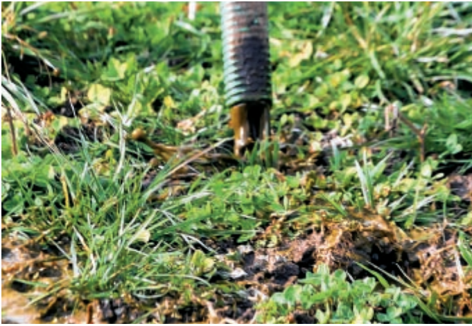
Richtig: Die Schläuche werden leicht über dem Boden geführt, und die Gülle kann so schonend und ohne Spritzer abgelegt werden.