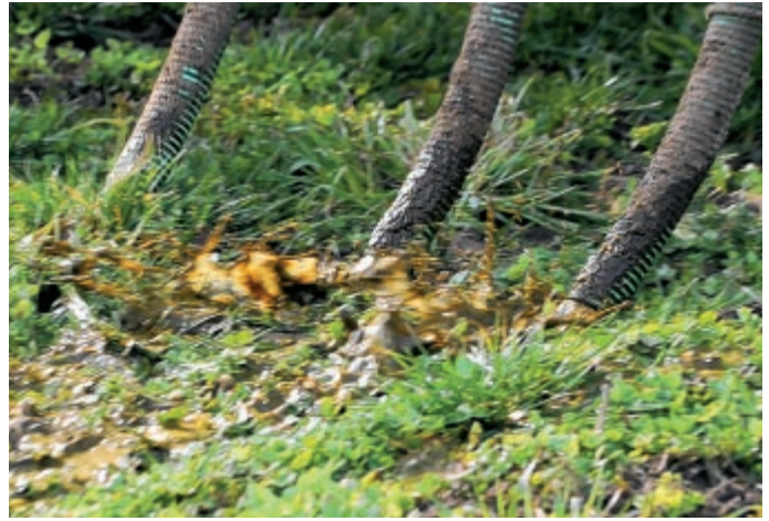
Falsch: Werden die Schläuche über den Boden geschleift, trifft die Gülle schräg auf die Grasbüschel, was zu vermehrter Spritzerbildung führt.

nigen und die Messer und Gegenschneiden mit etwas Öl vor dem Anrosten zu schützen.