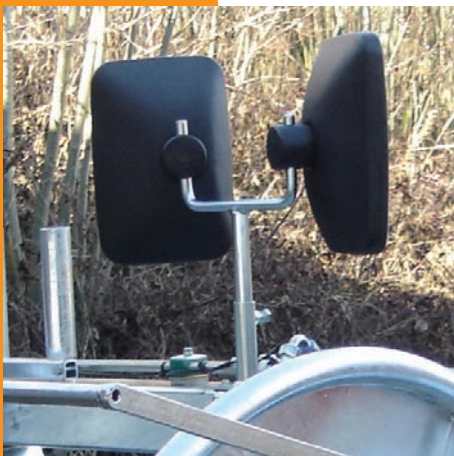
V-Spiegel verzinkt mit Halterung