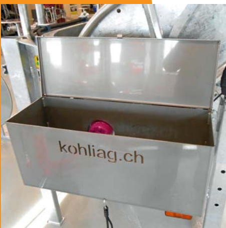
Materialkasten rostfrei - mit oder ohne Deckel