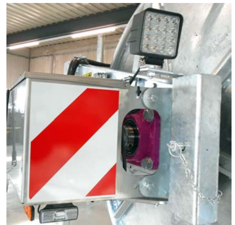
- LED-Positionslampen - LED-Arbeitscheinwerfer