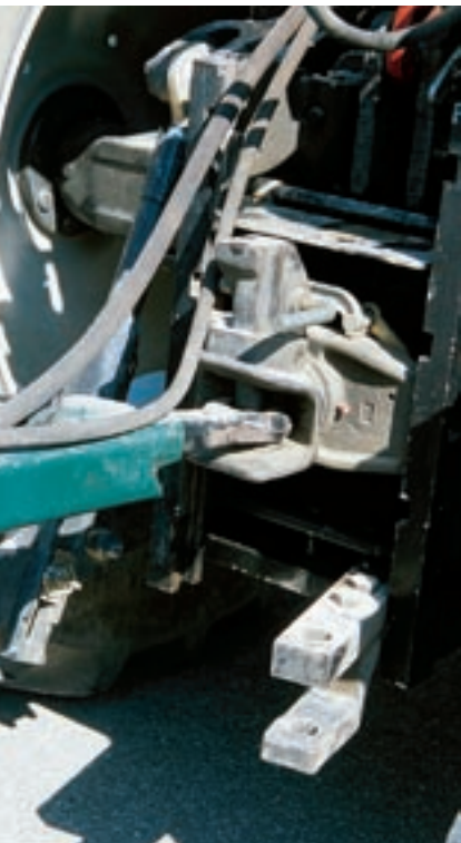
Selbsttätige Kupplung und DIN-Zugöse.

Der Vorteil der Obenanhängung ist ihre Vielseitigkeit, weil fast alle bisherigen Transport- oder Arbeitsanhänger kuppelbar sind. Nachteilig ist die Vorderachsentlastung bei Zugarbeiten, sodass die Lenkfähigkeit des Traktors eingeschränkt ist und sich die Frontballastierung aufdrängt. Die zulässige Stützlast am Zugmaul (Herstellerschild) kann den Einsatz begrenzen.