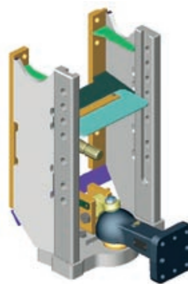
Mit der «Scharmüller-Kugelkopfkupplung 80» können Stützlasten bis 3000 kg spielfrei übernommen werden.

Da bei der Untenanhängung die Zapfwelle über der Deichsel geführt wird, ist der intakte Zapfwellenschutz besonders wichtig.